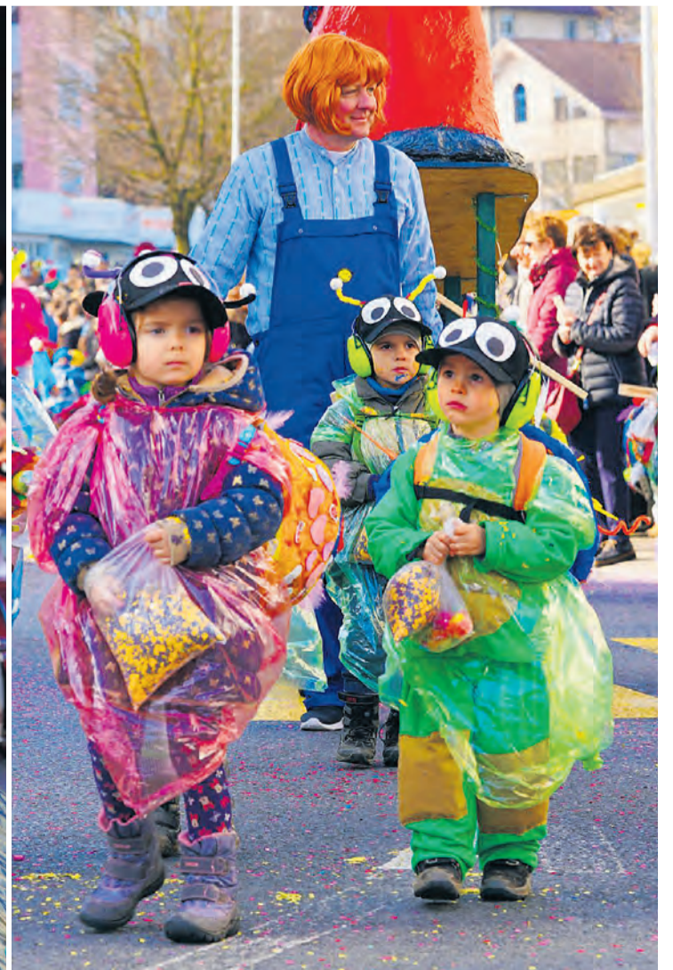
Impressionen von der Rätsschefasnacht: Hoher Hexenbesuch aus Kriens, dahinter die Tröpfeler Root (Bild links), ein imposanter musikalischer Auftritt der Lugumu, der ältesten aktiven Guggenmusik aus Luzern (Mitte), und die staunenden Gesichter der «Schnäggi»-Schnäggli aus Adligenswil (rechts).