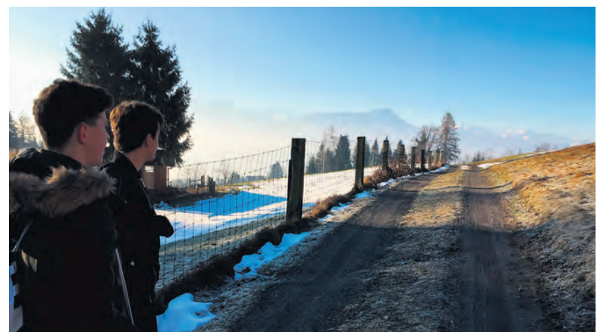
Bei bestem Winterwetter wanderten die Schüler in der Region Luzern.