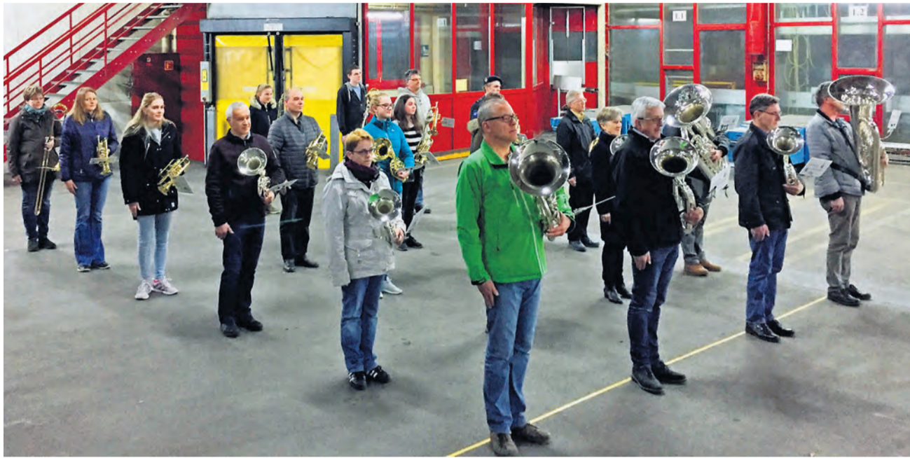
Die Feldmusik Adligenswil bei der Parademusik-Probe in einer leeren Halle im Businesspark H1.

Die Feldmusik stellt sich diesen Sommer einer nicht alljährlichen Herausforderung. An einer ausserordentlichen Generalversammlung im November war mit grosser Mehrheit beschlossen worden, am Luzerner Kantonalen Musiktag vom 1. und 2. Juni in Altishofen teilzunehmen. Nach 18 Jahren Abstinenz ist dies ein grosser Schritt für den Dorfverein.