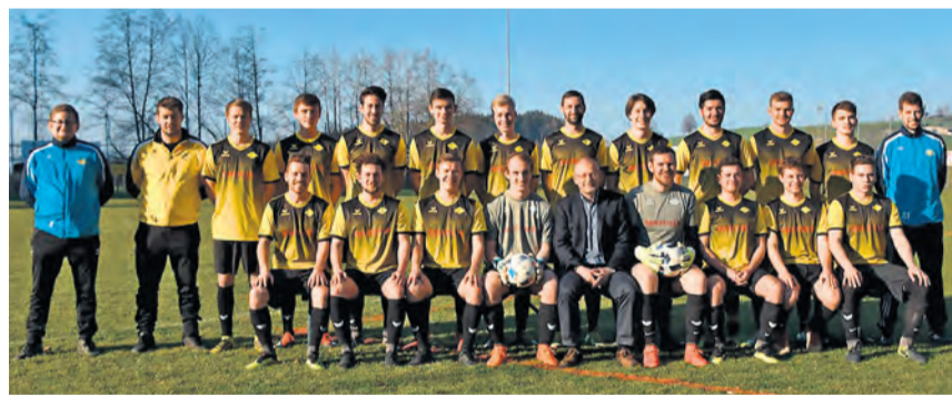
Die erste Mannschaft des FC Adligenswil mit dem neuen Dress.