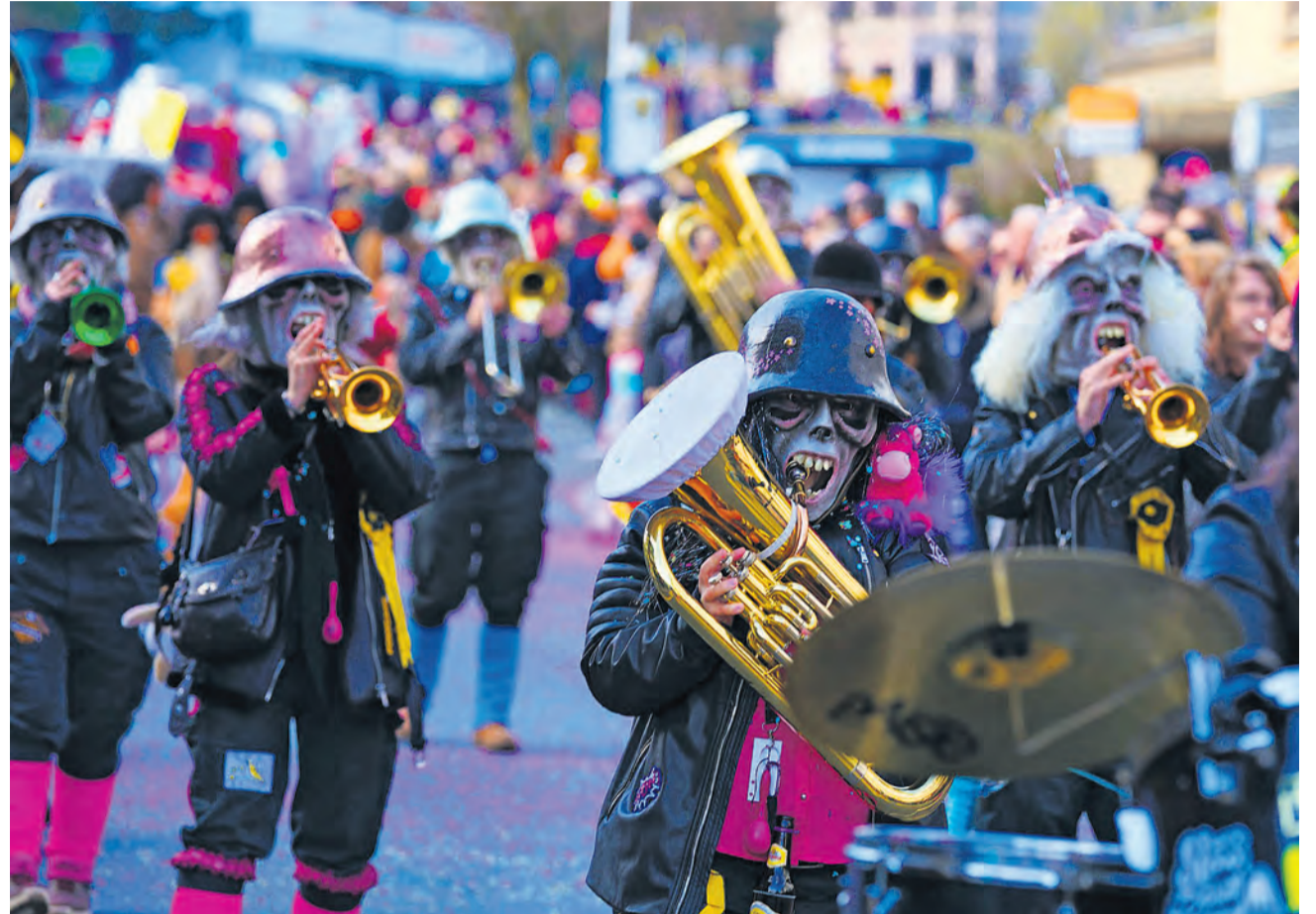
Heimvorteil für die Mölibachgeischer – mit einer Ehrenrunde im «Rössli»-Kreisel sorgten sie für Aufsehen.

Am Abend überraschte der Rätsscherat die Fasnächtler auf dem unteren Schulhausplatz mit einer toll inszenierten «Rätsscheverbrönnete». Ein Knaller, Konfettiregen und die mu-