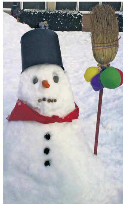
Diesen Schneemann bauten Kindergartenkinder.