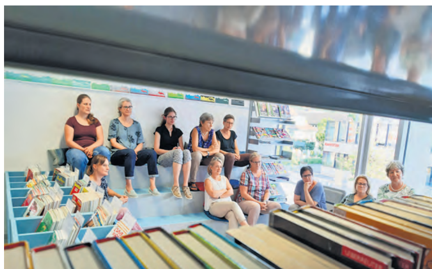
Aufmerksame Zuhörerinnen und Zuhörer in der Bibliothek.