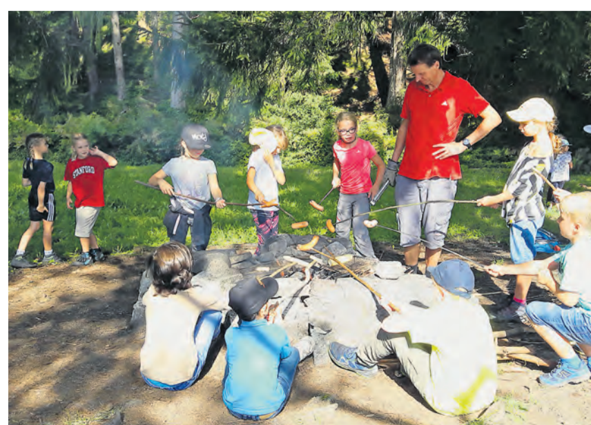
Ein «Lagerfeuer» fördert die Gemeinschaft und das gegenseitige Vertrauen.

Welche Höhepunkte das Jahr bereithält, werden Fotos, Berichte und Texte dokumentieren. Aktuell lässt sich die Atmosphäre an den Fotos der Herbstwanderung ablesen. Die gesamte Primarschule war am 16. September unterwegs: Die Jüngsten aus dem Kindergarten wanderten über