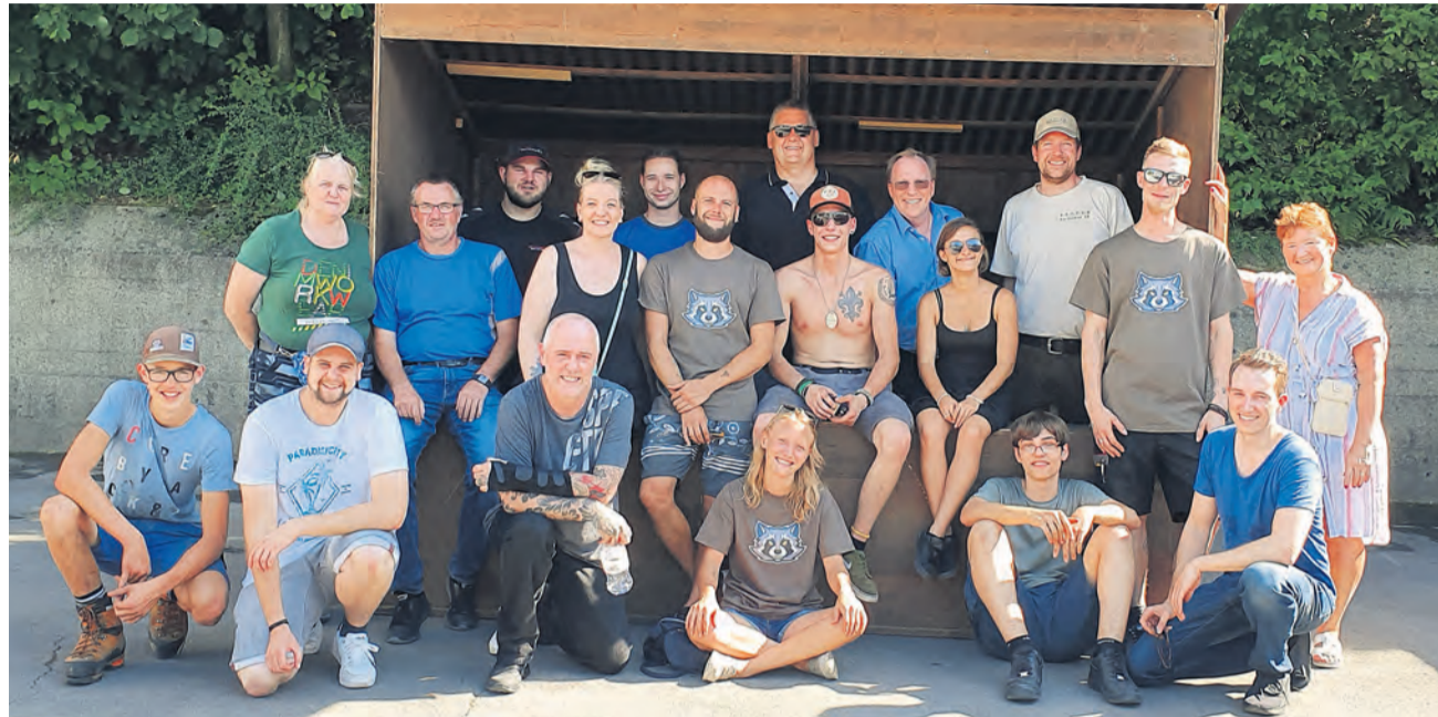
Das Auf-und-Abbau-Team vor einem der Chilbi-Stände.

Wieder einmal konnte der Gewerbeverein Adligenswil dank grossartiger und zahlreicher personeller Unterstützung durch verschiedene Gewerbevereinsmitglieder die Chilbi Adligenswil mit dem Aufbau der Stände unterstützen. Neu dabei war eine Delegation des neu gegründeten Vereins «The Coons Tactical Sports», der anschliessend an der Chilbi ein erfolgreiches Debüt feierte. Mit The Coons wurde den Jugendlichen an der Chilbi ein attraktives Angebot präsentiert.