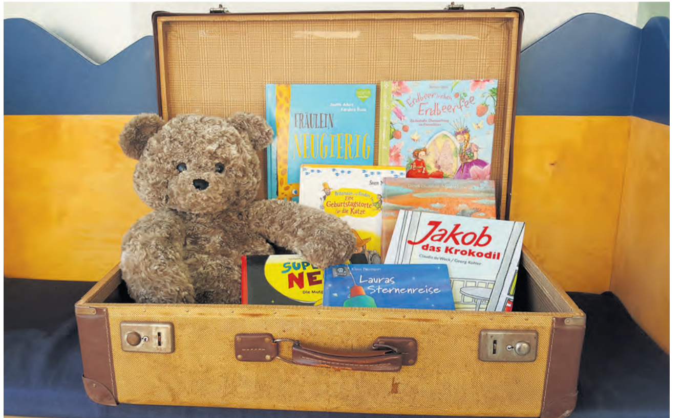
Der Bär reist um die Welt und sammelt in seinem Koffer Geschichten für die Kleinen.