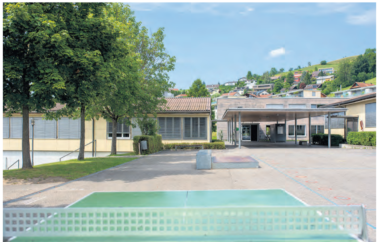
Mit dem Ja zum Budget 2022 haben die Stimmberechtigten auch den Projektwettbewerb für den Neubau der Schulanlage Kehlhof bewilligt.

Gestartet wird der Projektwettbewerb im Januar 2022, die Eingabe der Beiträge und Modelle der Planerteams wird bis im Mai 2022 erfolgen. Nach der Jurierung werden der Bericht des Preisgerichtes und der Entscheid im Sommer 2022 vorliegen. Für den Wettbewerb steht eine Preissumme von 195 000 Franken zur Verfügung. Der Wettbewerb wird als offenes Verfahren nach SIA-Norm 142 ausgeschrieben.