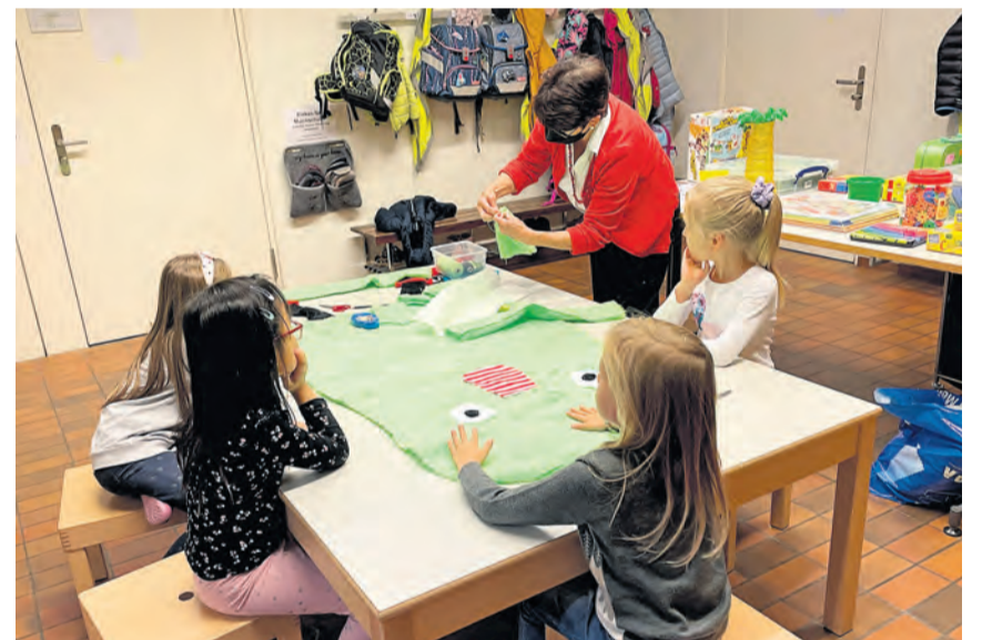
Hier entsteht das kleine «Wir».