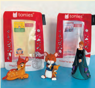
Die Tonies sind Hörfiguren. Auf ihnen sind Hörspiele, Musik und Sachwissen gespeichert.