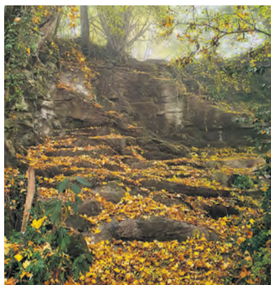
Nadine Felber hat für uns den Wasserfall ohne Wasser, dafür mit Herbstlaub fotografiert.