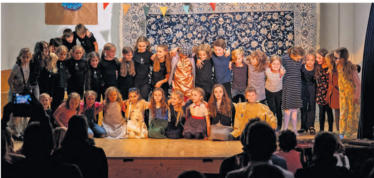
Sie hatten den Applaus verdient – die jungen Schauspielerinnen und Schauspieler der Pfadi Zytturm.

Am 23. Oktober 2021 fand endlich wieder ein Pfadi-Schnuppertag statt, und was für einer! Mit einer episch anmutenden Theaterinszenierung der Pfadileitung und selbstgemachtem Popcorn für die Wölfli wurde das Pfadijahr 2021/22 so richtig lanciert. Für alle, die am Schnuppertag nicht dabei sein konnten oder die sich einfach sonst noch anmelden wollen, gibt es unter www.pfadi-zytturm.ch ein Anmeldeformular. Wir freuen uns stets über frischen Wind in der Pfadi!