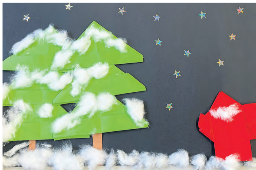
Weihnachten – eine Kinderzeichnung aus der 1. Klasse.

Schon bald feiern wir Weihnachten und Silvester steht vor der Tür. Die Adventszeit hat begonnen und in der Schule, in den Schulzimmern und den Tagesstrukturen Einzug gehalten. Auch in Zeiten von Corona wird mit Freude gebastelt und gesungen, und die Fenster und die Räume werden adventlich geschmückt. Der Advent ist die Zeit der Vorfreude, die wir auf vielfälti-