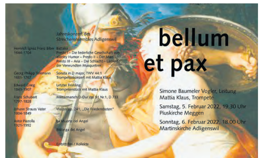
«Krieg und Frieden», vom Streicherensemble musikalisch interpretiert.