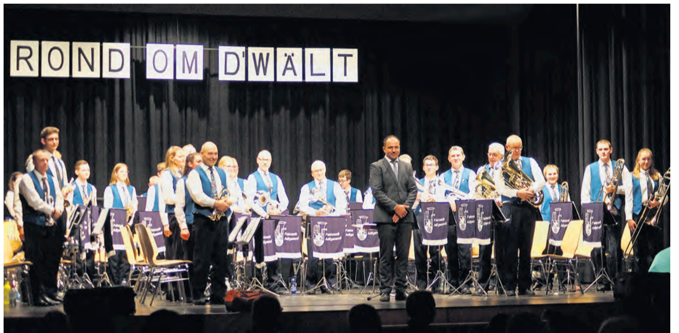
Die Musikantinnen und Musikanten genossen den verdienten Schlussapplaus sichtlich.

Am 19. und 20. November 2021 war es so weit: Nach dem Ausfall vom letzten Jahr fand endlich wieder ein grosses Konzert der Feldmusik Adligenswil statt. Trotz Zertifikatspflicht erschienen zahlreiche Zuhörerinnen und Zuhörer zum Konzert; dieses stand unter dem Motto «Rond om d'Wält».