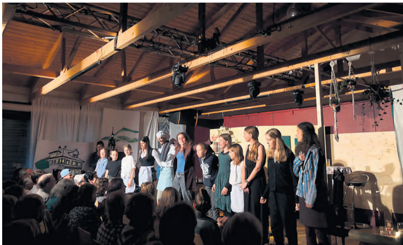
An der Dorniere ernteten die Spielerinnen und Spieler des Generationentheaters den wohlverdienten Schlussapplaus. Sämtliche Vorstellungen im Kinder- und Jugendtreff waren restlos ausverkauft.