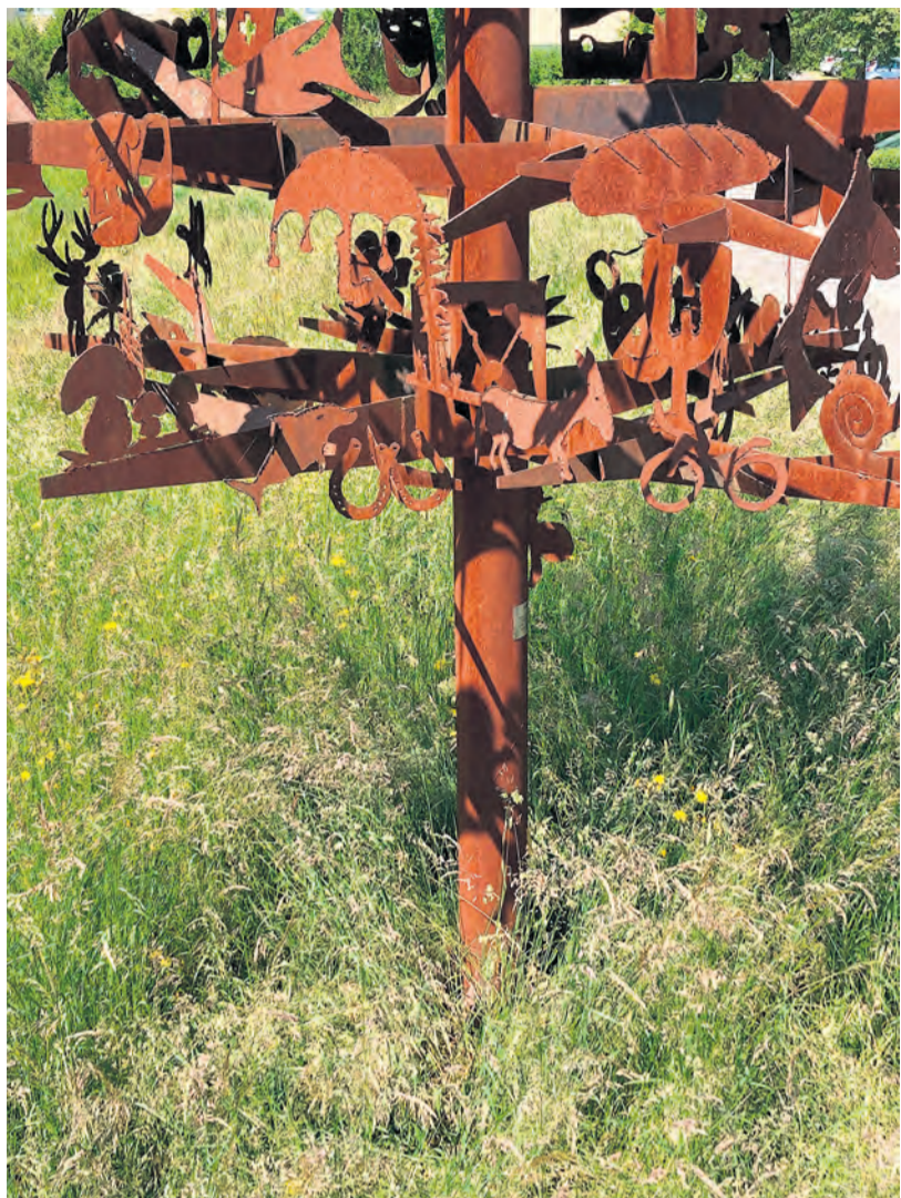
Wo in Adligenswil befindet sich diese Skulptur?