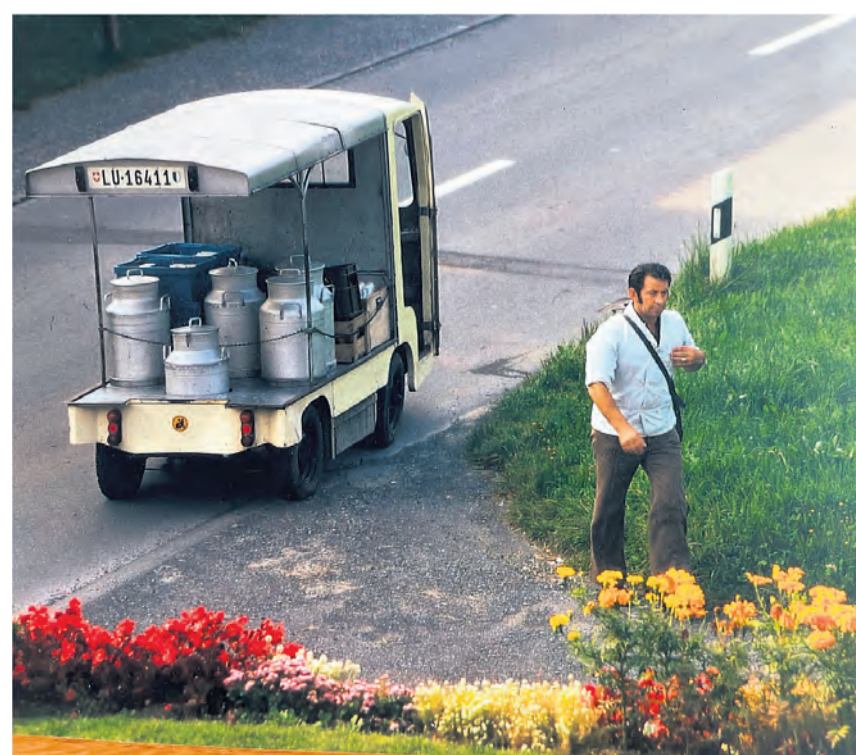
So kannte ihn ganz Adligenswil – als Milchmann, hier in den Sechzigerjahren mit seinem Milchwagen an der Luzernerstrasse 36.

In seiner Amtszeit entwickelte sich Adligenswil vom Bauerndorf mit 900 Einwohnerinnen und Einwohnern zu einer Agglomerationsgemeinde mit über 2000 Personen. Diese rasante Entwicklung forderte den damaligen Gemeinderat in allen Belangen. Schulhäuser mussten gebaut, Bauvorschriften und Ortsplanungen erarbeitet werden. Das Zusammenwachsen von Uradligern und Neuzuzügerinnen und Neuzuzügern gelang in Adligenswil dank einer ausgeprägten Vereinskultur und dem grossen politischen Gestaltungswillen der bisherigen und neuen Einwohnerinnen und Einwohner.