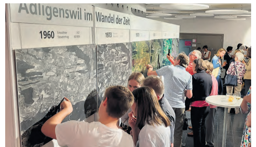
An der Vernissage der Ausstellung herrschte Grossandrang – und Stauen darüber, was einmal an der Stelle war, wo heute das eigene Haus oder die Wohnung steht.