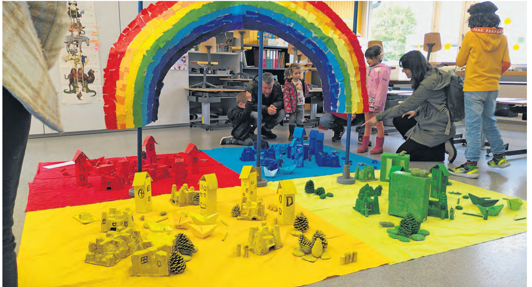
Für die «Welt der Farben» wurde gemalt, gepinselt und gebastelt. Sogar die Farben wurden selber hergestellt.

Ein anderes Atelier beschäftigte sich mit Backen, Dekorieren und sonstigen Vorbereitungen für die Ausstel-