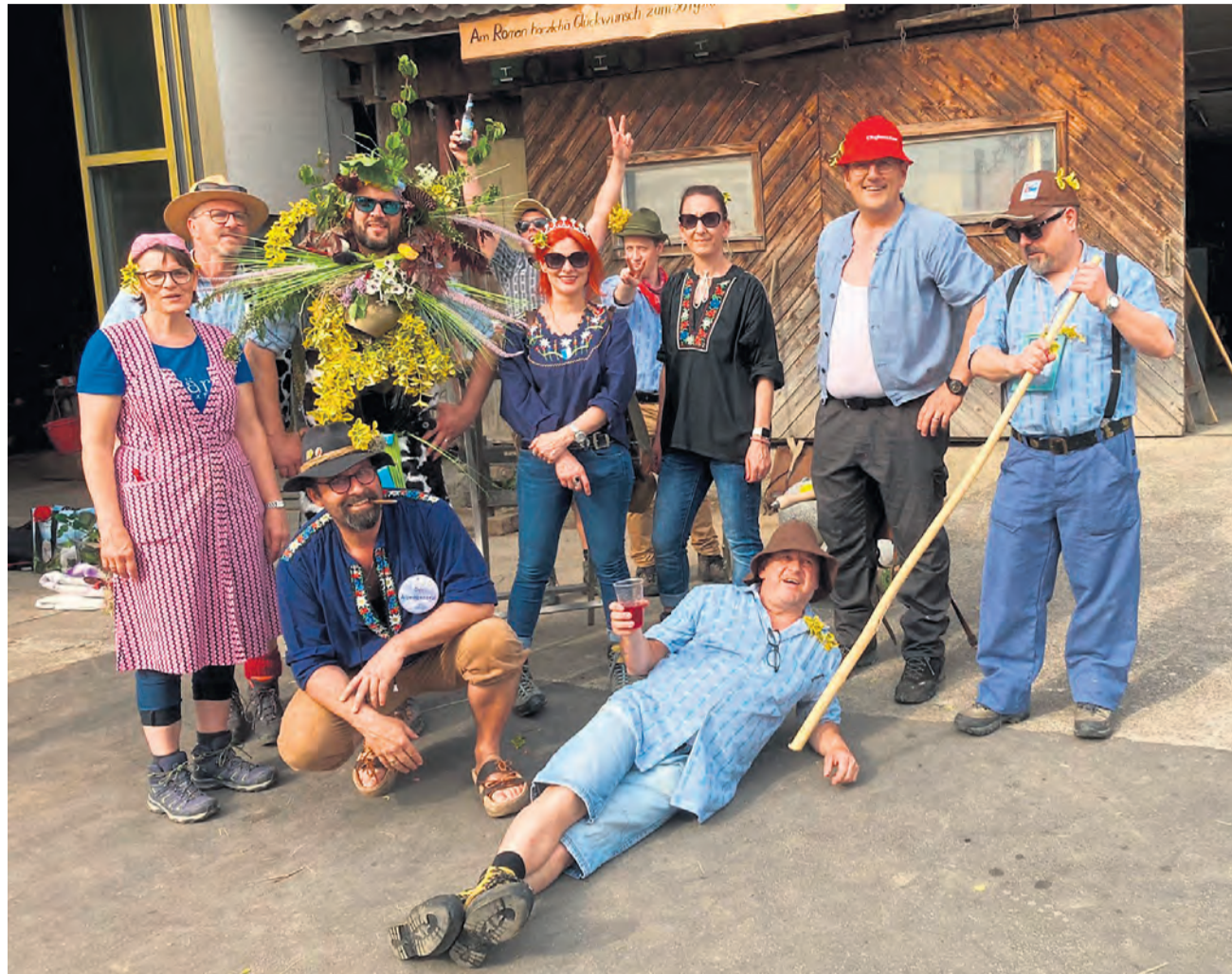
Alpaufzug mit geschmückter Leitkuh – für ausgelassene Stimmung ist bei den Adliger Rätsche gesorgt.

Mit den drei schön dekorierten «Leitkühen», die im Rahmen eines kleinen Wettbewerbs geschmückt wurden, ging es dann weiter in Richtung Jagdhütte auf der Stubenweid. Dort angekommen, wurden alle mit einem Apéro gestärkt und auf die Generalversammlung eingestimmt.