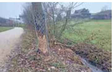
Der Biber beschädigte Bäume.

Der Werkdienst Adligenswil hat bei einer Kontrolle am Stubenbach beschädigte Bäume festgestellt. Zunächst war unklar, ob es sich dabei um einen Vandalenakt handelt. Nun ist aber klar: Ein Biber war am Werk. Er war im Herbst am Stubenbach aktiv und hat diverse Bäume beschädigt. Seitdem die Bäume mit einem Zaun geschützt werden, konnten aber keine weiteren Beschädigungen festgestellt werden.