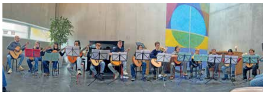
Das Gitarrenensemble der Musikschule Adligenswil.

Den Auftakt bildeten am 8. November die Vorspiele von 22 Instrumentalistinnen und Instrumentalisten beim kantonalen Stufentest im Zentrum Teufmatt. Nur wenige Tage später folgte der Gastauftritt in der St. Charles Hall Meggen (16. November). Am 21. November eröffnete die Jugendmusik das Feldmusikonzert im Zentrum Teufmatt. Besonders dicht war das Programm am 22. November: Am Morgen traten Pianistinnen, Bläser und Gitarristinnen beim Adventskonzert in der Thomaskirche Adligenswil auf, begleitet von der Formation Christmas Brass auf dem Teufmattplatz. Am Abend sorgten die Band Teen und die Jugendmusik für die musikalische Begleitung des