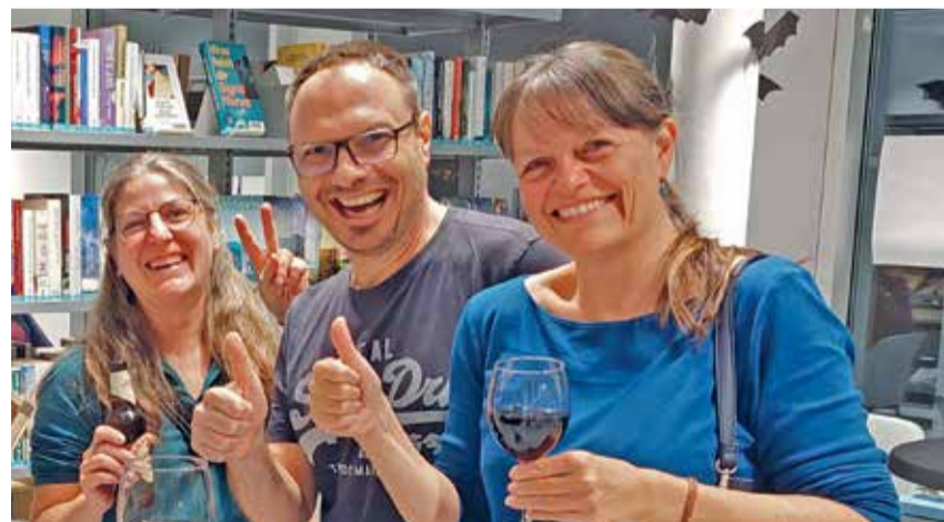
Der Anlass «Escape-Koffer» erfreut sich grosser Beliebtheit.

24 Personen, darunter erfreulicherweise fast die Hälfte junge Erwachsene, stellten sich Ende Oktober in fünf Teams dieser Herausforderung und begaben sich auf eine Reise durch verschiedene Epochen – ausgestattet mit Köpfchen, Kombinationsgabe und einer grossen Portion Lust auf gemeinsames Knobeln. Fünf Rätsel galt es zu lösen, um die fünf Schlösser der geheimnisvollen Koffer zu öffnen. Die Hinweise dafür waren raffi-