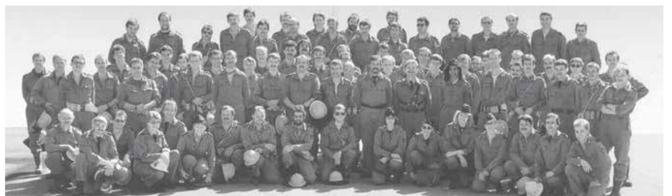
Die Feuerwehr Adligenswil mit allen Mitgliedern – heute (oben) und 1995 (unten).