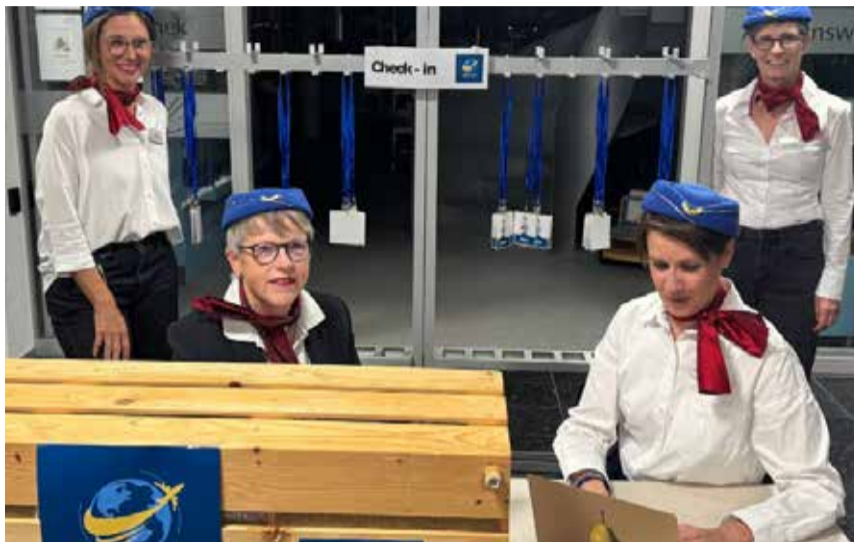
Flugbegleiterinnen empfangen die jungen Reisenden.

Bevor es aber losgehen konnte, gab es eine Sicherheitseinweisung der besonderen Art: humorvoll, komödiantisch und definitiv nicht BAZL-zertifiziert. Das Flugpersonal nahm es dabei mit den Vorschriften genau – so erinnerte die Purserette ihre Kollegin daran, dass rote Lippen bei Biblio Air Pflicht sind. Auch Gurtpflicht, Schwimmwesten und Sauerstoffmasken wurden erklärt – so witzig,