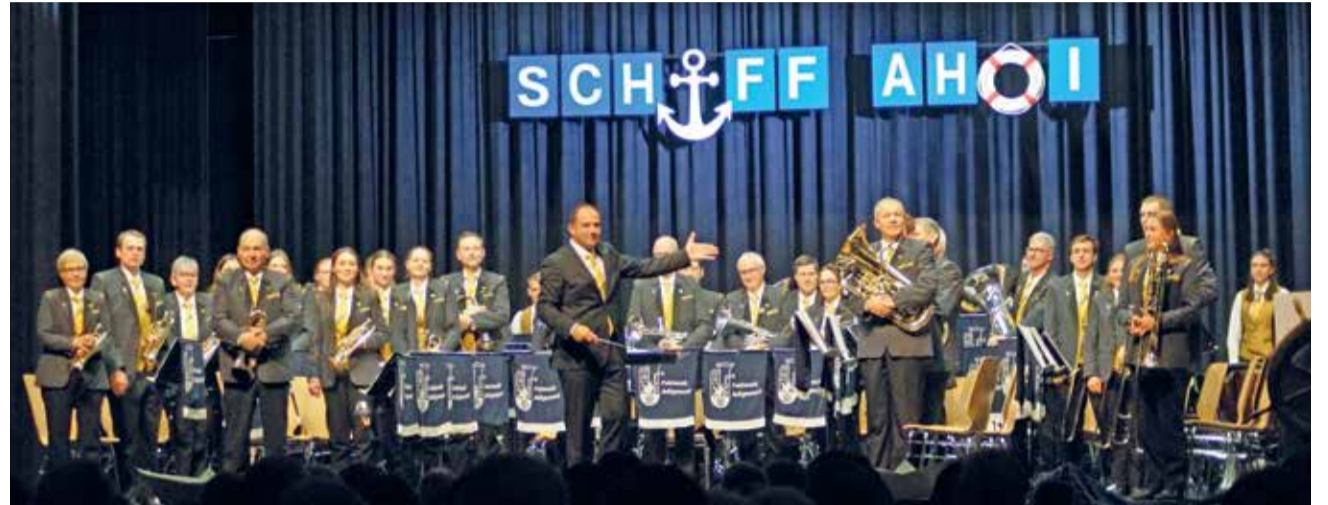
Die Feldmusik Adligenswil bei ihrem Jahreskonzert «Schiff ahoi».

Am 21. und 22. November feierte die Feldmusik Adligenswil ihren musikalischen Jahresabschluss bei einem Konzert mit zahlreichen Gästen.