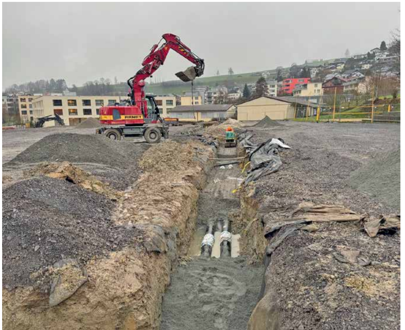
Im Spätherbst erfolgten die Umlegung der Fernwärmeleitung sowie die Verlegung der Kanalisation.

Im Anschluss wurden die Gräben für die Fernwärme geschlossen und die Arbeiten am Bohrplanum für die Pfählung vorbereitet. Ab dem 9. Dezember 2025 starteten die Pfählungsarbeiten, die bei optimalem Verlauf vor Weihnachten abgeschlossen sein dürften. Aufgrund der Niederschläge im November kam es beim Start der Pfählungsarbeiten zu leichten Verzögerungen. Während der Pfählung ist mit erhöhten Lärmemissionen zu rechnen. Die Pfählungen werden allerdings mittels Bohrentechnik ausgeführt, was die Lärmemissionen im Vergleich zu anderen Techniken stark verringert und Erschütterungen minimiert. Beim Schulhausneubau wird anstelle eines Spatenstichs die