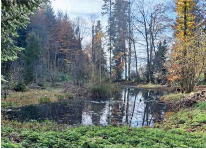
Wo befindet sich dieser schöne Weiher?