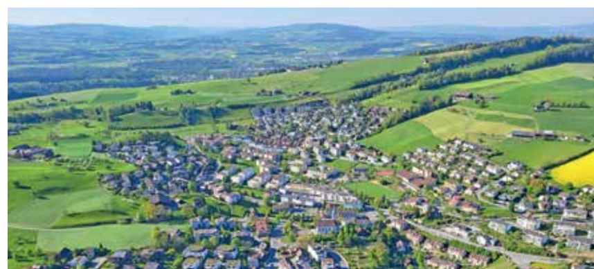
Raphael Lohri gelingen spektakuläre Aufnahmen.