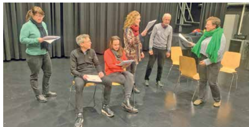
Woche für Woche wird fleissig geprobt für die Premiere Ende Februar.