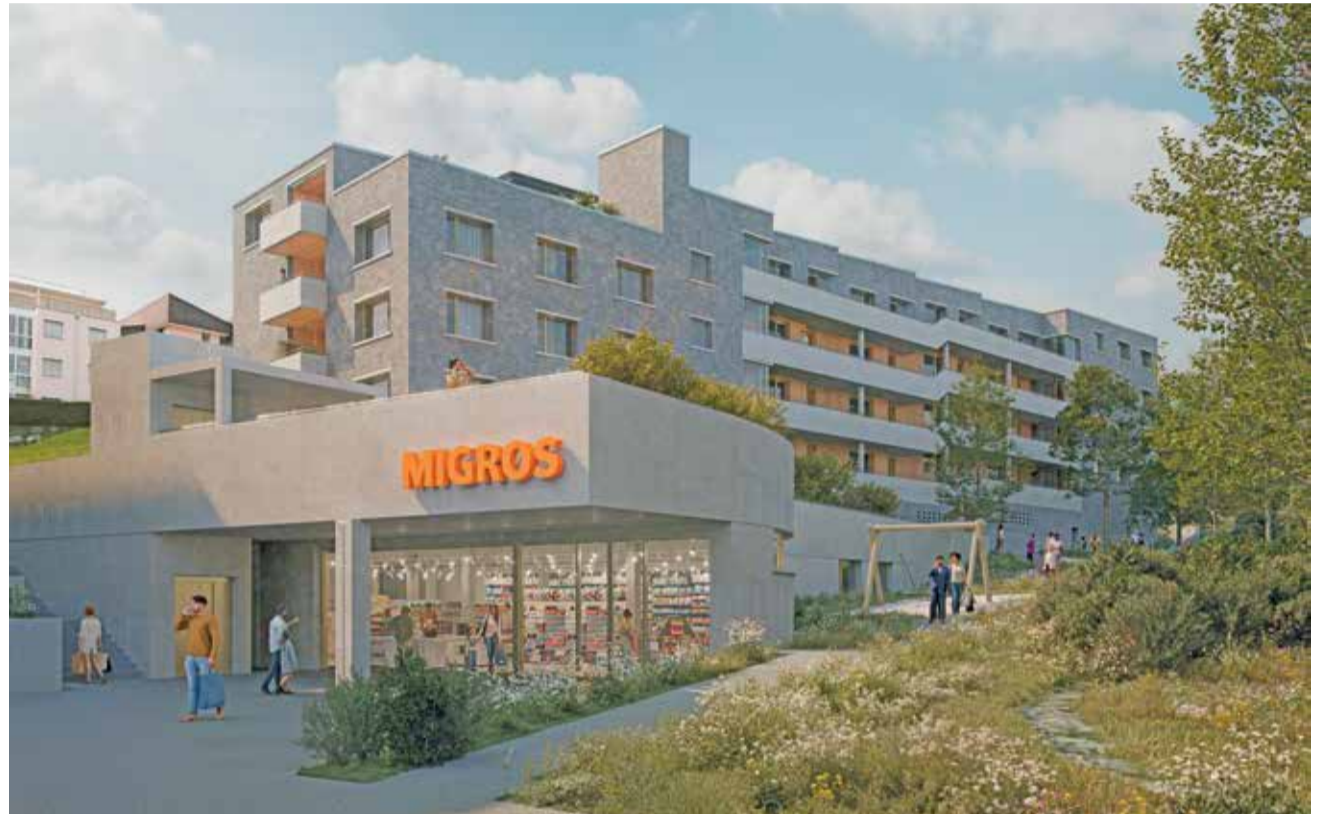
So soll sich der Neubau beim Bützi-Areal dereinst präsentieren.

Das Bauprojekt wurde von der Liberalen Baugenossenschaft Adligenswil in enger Zusammenarbeit mit dem siegreichen Architekten des Wettbewerbs weiterentwickelt. Mitglieder der Jury, die das Projekt be-