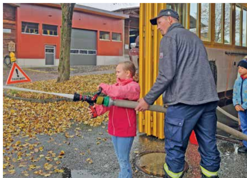
Die Primarschulkinder durften beim Besuch sogar ein Feuer löschen.