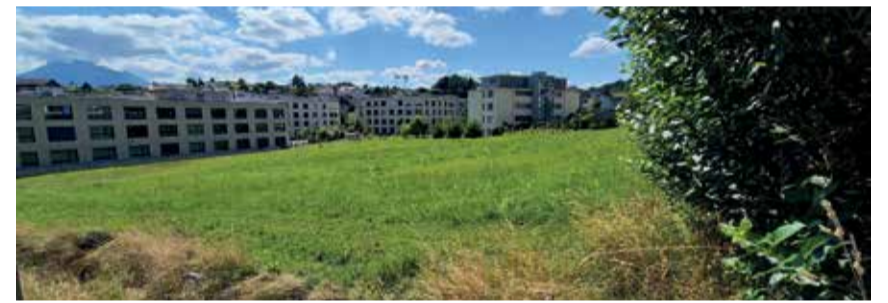
Die Brache 909 soll belebt werden.

vette als Treffpunkt für Jung und Alt werden. Zum Zusammenkommen und Verweilen benötigen wir aber auch Wege und Sitzgelegenheiten.