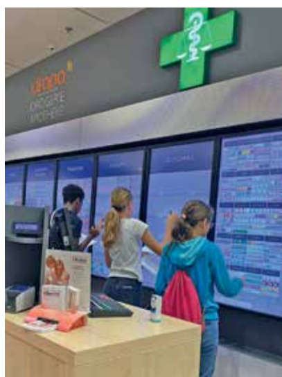
Rund 70 Schülerinnen und Schüler besuchten den Berufswahlparcours, der zum vierten Mal stattfand.

Ein weiterer fixer Bestandteil im Jahreskalender ist das traditionelle Sternstellen zum 1. Advent. Der 4,5 Meter hohe leuchtende Weihnachtsstern wurde vom UNA-Vorstand auf den Dottenberg transportiert und installiert. Seit etlichen Jahren prägt er das vorweihnächtliche Dorfbild von Adligenswil und ist für viele Einwoh-