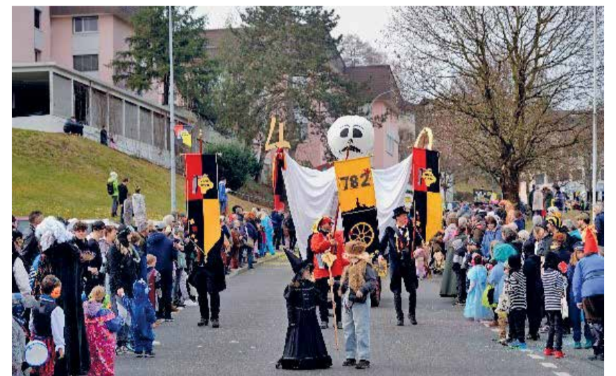
Der Rätsche-Umzug zog im Jahr 2025 viele Fasnachtsbegeisterte an.