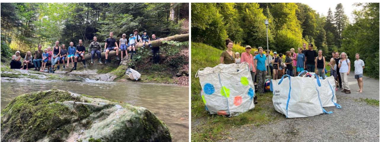
In diesem Jahr erstmals durchgeführt: ein Neophytenbekämpfungseinsatz mit Freiwilligen am Würzenbach. (SE 13.8.2025)