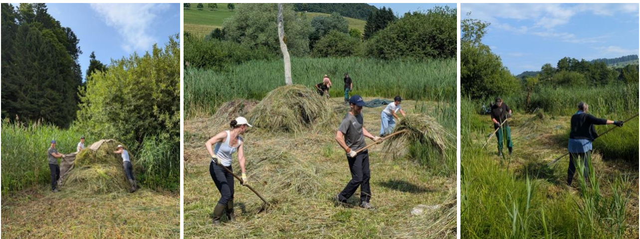
In der «Frühschnittfläche» im Moosried findet seit 2007 jährlich ein Arbeitseinsatz mit Freiwilligen statt. (SE 5.7.2025)