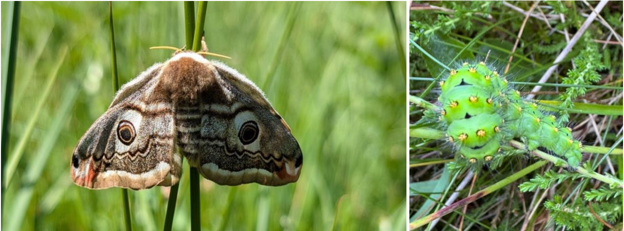
Kleines Nachtpfauenauge Saturnia pavonia im Weierried: ein ausgewachsenes Weibchen (links, 16.5.2025) und eine halberwachsene Raupe. (rechts, 28.6.2025)