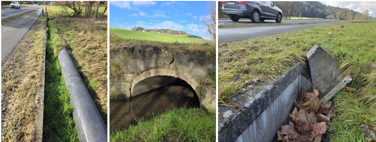
Die freigelegte Drainageröhre (links) und der eingestaute Hauptdurchlass (mitte) vermindern die Funktionstüchtigkeit der Amphibienanlage Moosried. Zudem müsste eine Umkehrschleufe (rechts) saniert werden. (KM 7.1./7.2./28.3.2025).

Mängel an der Amphibienanlage Moosried: Der Hauptdurchlass der Amphibienanlage steht nach wie vor häufig unter Wasser und vermindert dadurch deren Funktionstüchtigkeit. Zudem erschwert eine Drainageleitung, die parallel zum Leitwerk verläuft und durch den Hangdruck immer mehr zur Strasse hin verschoben wird, den Unterhalt. Die Probleme wurden zwar mit der Dienststelle lawa bereits mehrfach diskutiert, eine Lösung ist aber noch nicht in Sicht. Die Situation soll Anfang 2026 mit Vertretern der involvierten Stellen vor Ort analysiert werden.