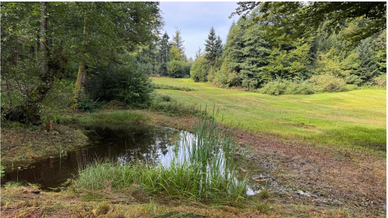
Blick ins frisch gemähte Wildsauried, mit dem vor zwei Jahren erstellten Waldweiher im Vordergrund.

Naturschutzgebiete im Meggerwald / Underer Wald