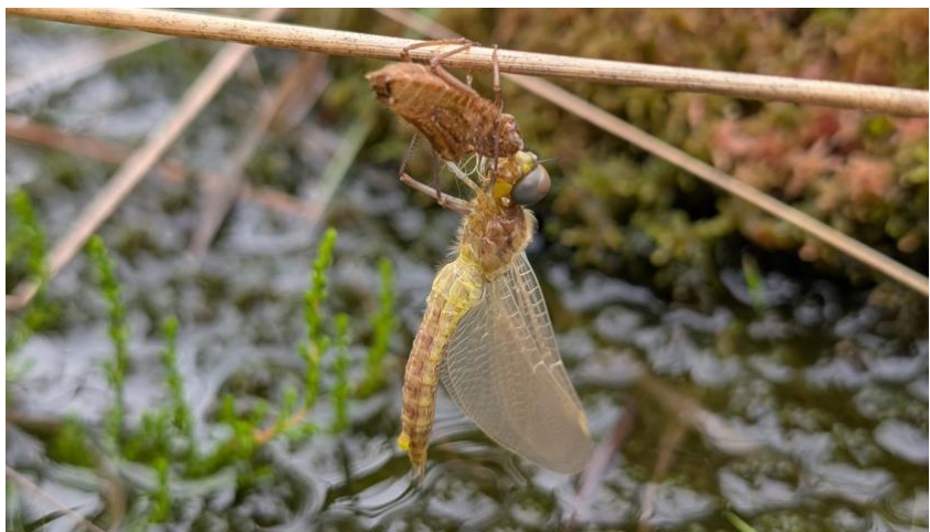
Schlupf der Arktischen Smaragdlibelle Somatochlora arctica im Schlittenried: ein Erstnachweis im Meggerwald.