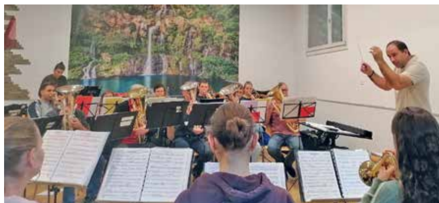
Probenbetrieb der Feldmusik Adligenswil.

Beim Wettbewerb wird die Feldmusik ein Selbstwahlstück und ein Aufgabenstück um 14.35 Uhr vor der Jury vortragen. Anschliessend präsentiert sie um 18.18 Uhr auf der Marschmusikstrecke den Marsch Arosa. Das Selbstwahl- wie auch das Marschmusikstück konnten bereits am letzten Jahreskonzert aufgeführt werden. Wer auch das anspruchsvolle Aufgabenstück live erleben möchte, hat die Möglichkeit, am Sonntagabend, 3. Mai, das Vorbereitungskonzert in Ebikon zu besuchen.