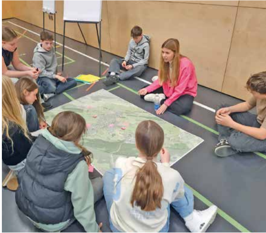
Schülerinnen und Schüler identifizierten mit Fach- und Lehrpersonen heikle Stellen und erarbeiteten erste Lösungsvorschläge.

Am 9. und 10. März 2026 wurde während zweier Vormittage von ausgewählten Lernenden eifrig über die Schul- und Velowege in Adligenswil nachgedacht. Am ersten Tag wurden zwei Workshops mit Lernenden der 1. bis 4. Klasse durchgeführt. Manche brauchten noch etwas Hilfe beim Bestimmen ihres Wohnhauses. Dafür gab es Fachpersonen, die zusammen mit den Lehrpersonen einen sehr guten Job machten. Am zweiten Tag kamen die 5. und 6. Klassen sowie ausgewählte Lernende aus den drei Jahrgängen der Sekundarschule an die Reihe. Hier wurden in einem dritten Workshop sogar Massnahmen erarbeitet, die bei kritischen Stellen auf dem Schulweg Entschärfung bewirken können. Es wurde mit vereinten Kräften nach Lösungsmöglichkeiten gesucht. Das Kartenmaterial gab dazu einiges her. Die Schule Adligenswil dankt den Fach- und Lehrpersonen, die während dieser zwei Halbtage eifrig mit den Lernenden gearbeitet haben und eine Menge neuer Erkenntnisse geschaffen haben. Nun sind wir ge-