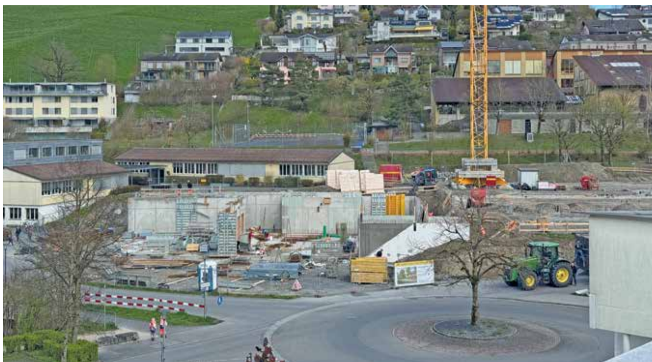
Die Struktur des neuen Schulhauses wird nun mehr und mehr erkennbar.

Mit dem Fortschreiten des Wandsystems entstehen zunehmend klar erkennbare Raumstrukturen, welche die spätere Nutzung bereits erahnen