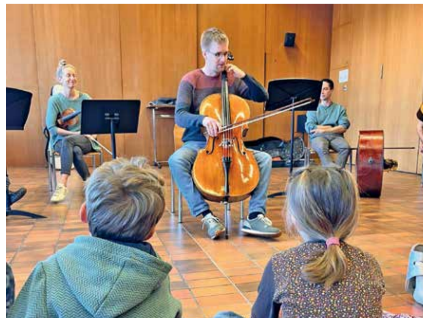
Die Erstklässlerinnen und Erstklässler lauschten der Instrumentenvorstellung gespannt.