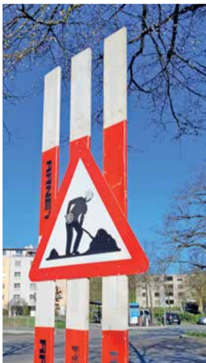
Wenn immer möglich sind bei Bauten heimische Betriebe beteiligt.

Die Gemeinde schätzt die einheimischen Unternehmen sehr und zeigt diese Wertschätzung auch dadurch, dass lokale Firmen wo immer möglich zur Offertstellung bei Arbeitsvergaben in gemeindeeigenen Liegenschaften eingeladen werden. Dem Gemeinderat und der Geschäftsleitung ist es ein zentrales Anliegen, das einheimische Gewerbe zu berücksichtigen. Diese Absicht ist in den Legislaturzielen für die Jahre 2024 bis