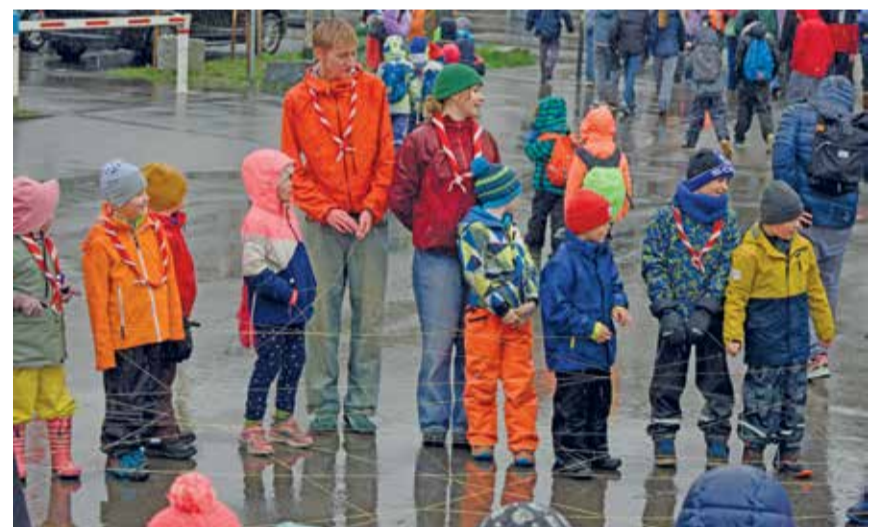
Interessierte Kinder trotzten am Schnuppertag dem nass-kühlen Wetter.

Am nationalen Pfadischnuppertag hat auch die Pfadi Zytturm eingeladen, unsere Aktivitäten zu entdecken. Trotz der eher winterlichen Kapriolen mit Regen und sogar einigen Schneeflocken liessen sich viele interessierte Kinder nicht abschrecken und tauchten mutig in den Pfadialltag ein.