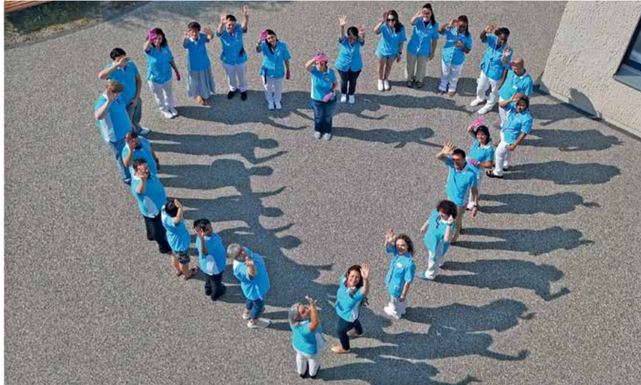
Die Alters- und Gesundheitszentrum Adligenswil AG blickt auf ein erfolgreiches 2025 zurück.

Auch im Bereich Nachhaltigkeit wurden konkrete Fortschritte erzielt: Mit der neuen Photovoltaikanlage und