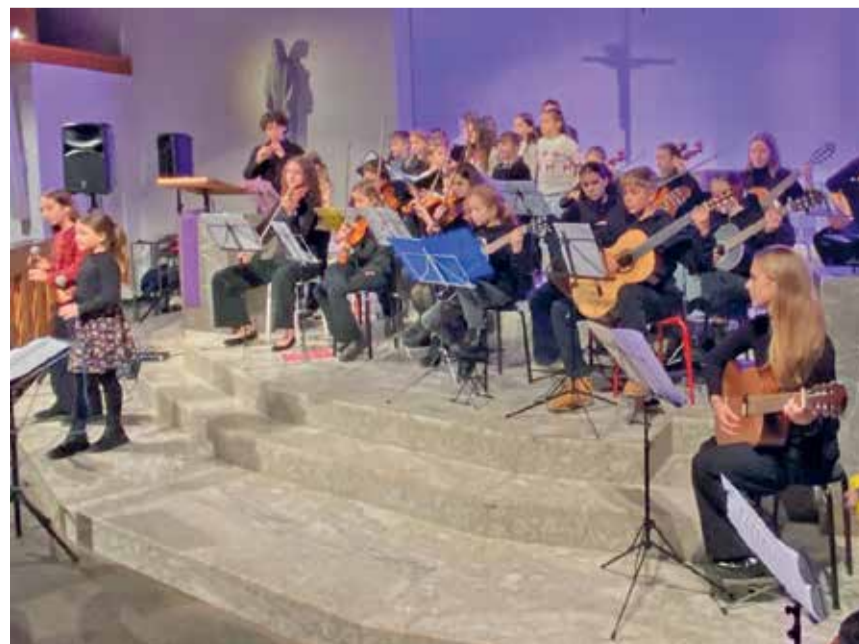
Sängerinnen und Musikschüler am vergangenen Weihnachtskonzert 2025 in Udligenswil.