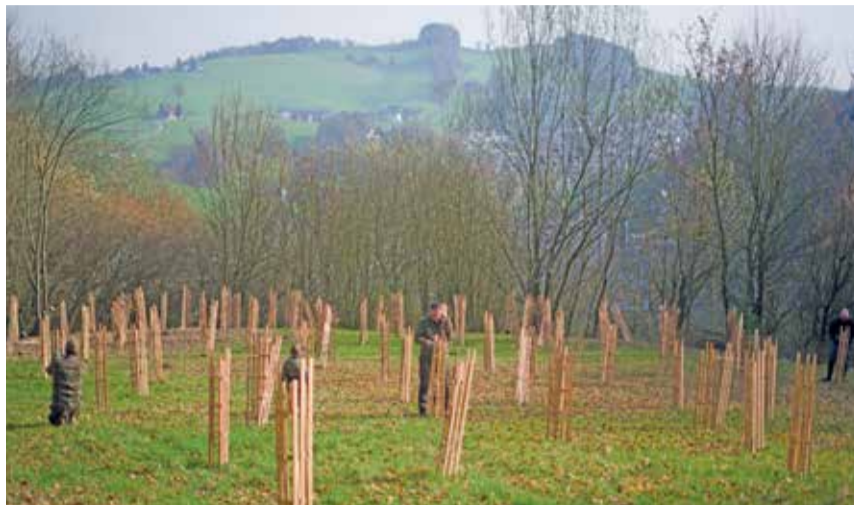
Eindruckliche Aufforstung im Gebiet Löösch.

Mischwälder sind das Fundament eines gesunden Ökosystems. Sie bieten Lebensraum für Rehwild, Fuchse, Kleinsäuger und hunderte Insektenarten. Die Traubeneiche allein beherbergt über 500 Insektenarten und bildet damit die Grundlage ganzer Nahrungsketten. Eiben ernähren Drosseln und Rotkehlchen, die Edelkastanie versorgt Wildschweine und Eichhörnchen. Arten-