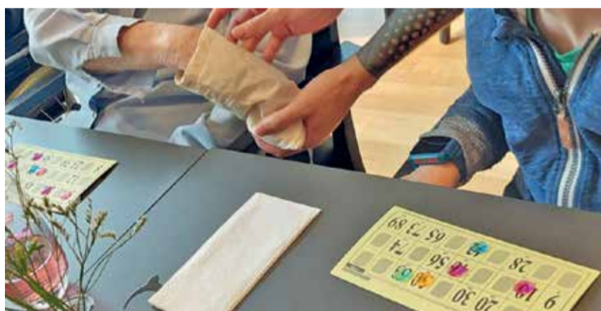
Der Lotto-Nachmittag erlaubte den Austausch zwischen Jung und Alt.

Im Rahmen der Offenen Kinder- und Jugendanimation Adligenswil (OK-JAA) wurde mit dem Pflegezentrum Riedbach ein generationenübergreifendes Angebot umgesetzt. Ziel war es, Begegnungen zwischen Kindern und älteren Menschen zu ermöglichen und den Austausch zwischen den Generationen aktiv zu fördern. Am Lotto-Nachmittag trafen Kinder auf Bewohnende des Pflegezentrums. In einer offenen und entspannten Atmosphäre wurde zusammen gespielt, gelacht und miteinander ins Gespräch gekommen. Das Lotto diente als niederschwelliger Zugang, der es allen Beteiligten erleichterte, miteinander in Kontakt zu treten.