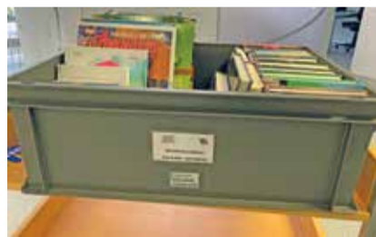
Eine der beliebten Bücherkisten.

bleiben, durchstöbert, entdeckt und geliebt werden, bevor sie weiterwandern. So haben die Kinder jederzeit eine vielfältige Auswahl an Büchern, stets griffbereit, ergänzend zum Besuch in der Bibliothek. Ein spontanes Blättern, ein leises Versinken oder das gemeinsame Entdecken eines Buches werden so selbstverständlich. Was mit wenigen Kisten begann, ist zu einem lebendigen Bestandteil des Klassenzimmers geworden. In diesem Schuljahr waren bereits 44 Kisten im Umlauf. Die Schule, die Kindergärten und Tagesstruktur schätzen dieses Angebot sehr. Sie vertrauen darauf, dass die Bibliothekarinnen mit viel Fachwissen und Herz die passenden Bücher auswählen. Die «Bücherschatzkiste» ist mehr als ein Projekt. Sie ist ein Zeichen dafür, was entstehen kann, wenn Schule und Bibliothek Hand in Hand arbeiten. Eine lebendige Lesekultur, in der Kinder die Freude am Lesen entdecken und mit jeder Geschichte ein Stück Welt für sich gewinnen.