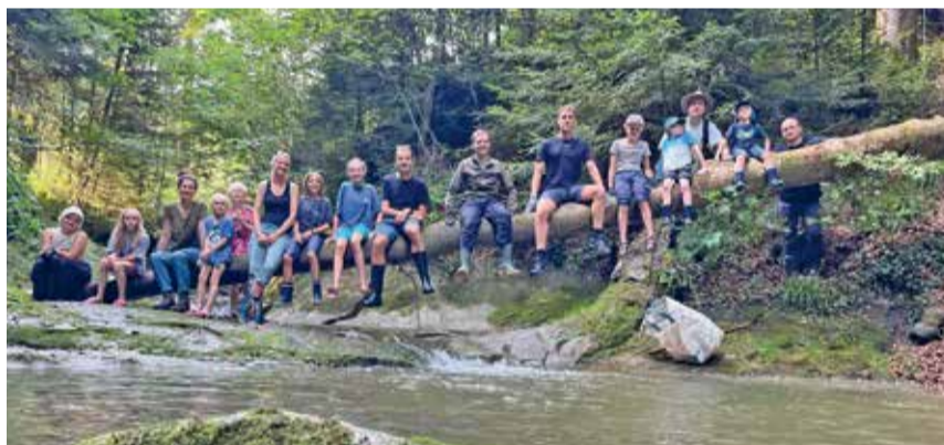
Exkursionen und Arbeitseinsätze des Vereins Vielfalter laden alle ein.

Zwischen Mai und September ist die Bevölkerung auch in diesem Jahr zu vielen verschiedenen Anlässen eingeladen. Bei Exkursionen tauchen wir gemeinsam mit Fachleuten in die Welt der Bienen oder Vögel ein. Bei den verschiedenen Arbeitseinsätzen kann man sich aktiv in der Natur be-