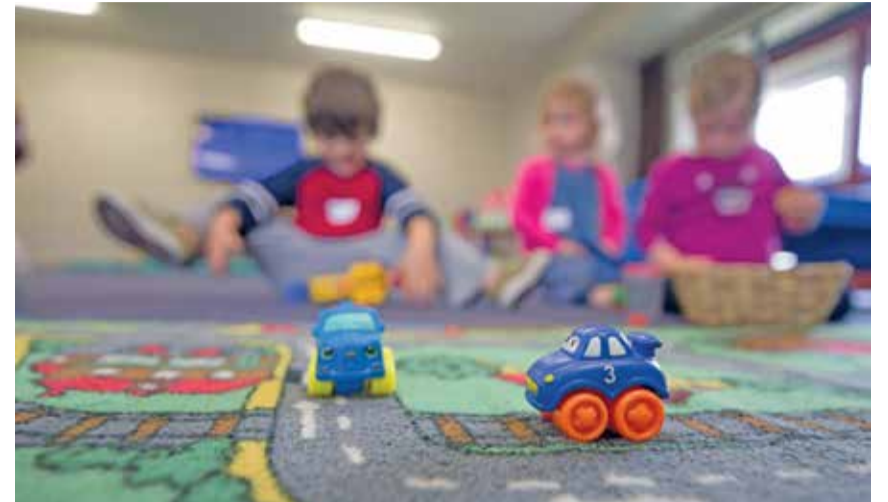
Die Stimmberechtigten stimmen im Juni über das revidierte Reglement über die familienergänzende Kinderbetreuung ab.

Zum anderen will die Gemeinde Adligenswil Familien bei der externen Kinderbetreuung wie bisher nicht nur mit Kindern in der Vorschulzeit, sondern auch Familien mit Kindern bis und mit der sechsten Primarklasse unterstützen. Die finanzielle Beteiligung der Gemeinde Adligenswil geht somit über jene des Kantons Luzern hinaus. Somit können auch Familien, welche die Tagesstrukturen nutzen, wie bis anhin in den Genuss von Betreuungsgutscheinen kommen. Unterstützung gibt es in der Gemeinde Adligenswil also im Vorschulbereich für den Kita-Besuch oder die Betreuung bei einer Tagesfamilie. Im Schulbereich ist eine Beteiligung an der Finanzierung des Besuchs von modularen Tagesstrukturen oder einer Tagesfamilie möglich. Dies wird im Reglement der Gemeinde Adligenswil in Paragraph 3 entsprechend geregelt. Anspruchsberechtigt für die Betreuungsgutscheine sind wie bisher Erziehungsberechtigte mit Wohnsitz in Adligenswil. Falls die Erziehungsberechtigten an unterschiedlichen Wohnorten angemeldet sind, muss das Kind den gesetzlichen Wohnsitz in der Gemeinde Adligenswil haben, damit Betreuungsgutscheine ausbezahlt werden können. Auch die Höhe der Erwerbstätigkeit, um in den Genuss von Betreuungsgutscheinen zu gelangen, ändert sich mit der Anpassung des Reglements nicht. Wie