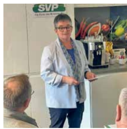
Nationalrätin Vroni Thalmann war zu Gast.

Ein positives Ergebnis ist erfreulich. Wiederholte grosse Abweichungen