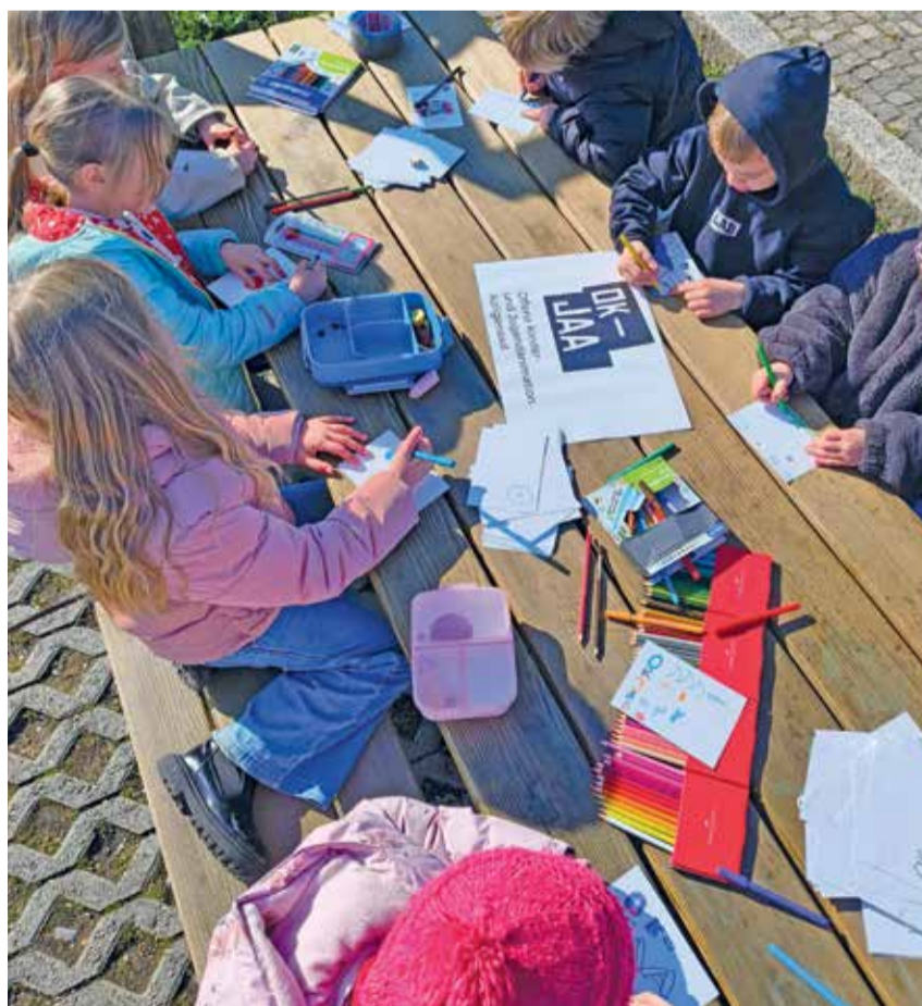
Beim Programm der OK-JAA können Kinder und Jugendliche kreativ sein.

Mitte Januar fand im Jugisorium die Neujahrsparty für alle Jugendlichen der 5. bis 9. Klassen statt. In partizipativer Zusammenarbeit wurde der Abend geplant und gestaltet. Die Jugendlichen dekorierten, führten die Bar mit alkoholfreien Drinks, machten