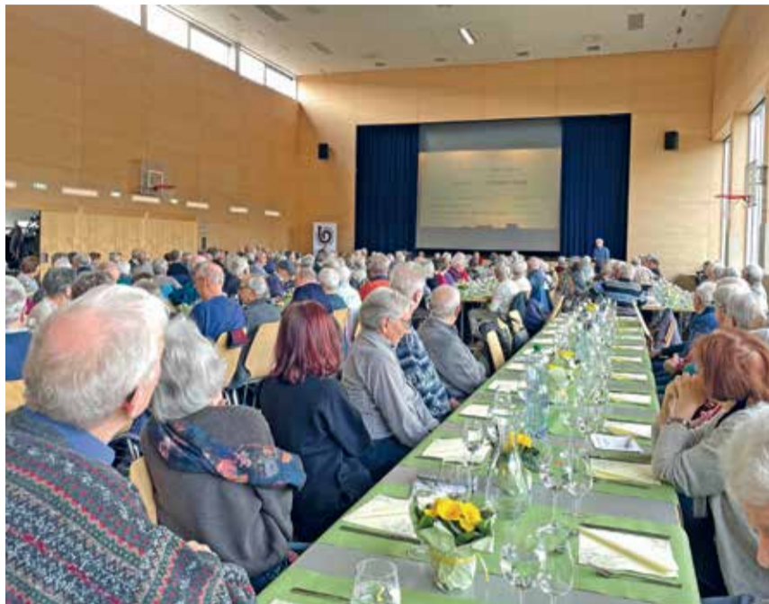
Fast 240 Vereinsmitglieder und Gäste besuchten die 35. Mitgliederversammlung im Zentrum Teufmatt.

Am Freitagnachmittag vor den Faschnachtsferien besuchten fast 240 Ver-